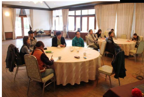
アウトプット中心だから身に着く！