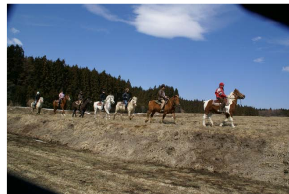
この時間を共有するだけでも価値があります