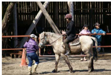
初心者は柵の中で練習します。